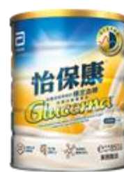
雅培怡保康 $97 / 400 克 $217.5 / 850 克