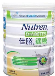
佳膳適糖 $95 / 400 克 $190 / 800 克