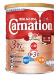
三花三效高鈣 較低脂奶粉 $100 / 750 克