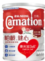
三花柏齡™健心 高鈣較低脂奶粉 $80 / 800 克