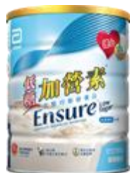
低糖加營素 $180 / 850 克