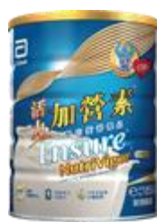
活力加營素 $217 / 850 克