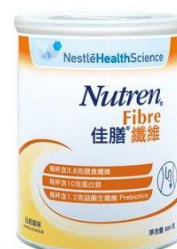
佳膳纖維 $152 / 800 克

備註 1：中心已收取每罐奶粉$2 行政費 備註 2：價格如有變動，以銷售時的定價為準