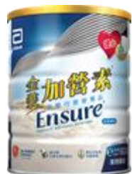
金裝加營素 $84.5 / 400 克 $175 / 900 克