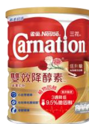
三花雙效降醇素™ 營養奶粉 $110 / 800 克