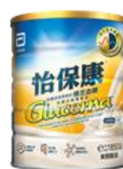
雅培怡保康 $97 / 400 克 $217.5 / 850 克