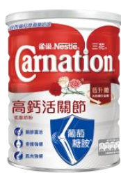
三花高鈣活關節 低脂奶粉 $95 / 800 克