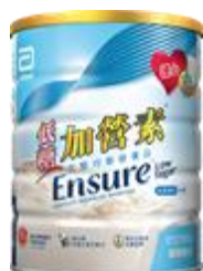
低糖加營素 $180 / 850 克