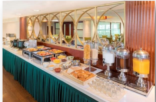
絲麗酒店金林閣自助餐