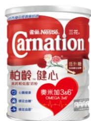
三花柏齡™健心 高鈣較低脂奶粉 $85 / 800 克