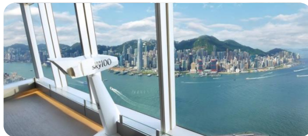
天際 100 及 5G 科技館