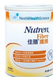
佳膳纖維 $145 / 800 克