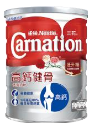
三花高鈣健骨 低脂奶粉 $85 / 800 克