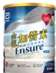
金裝加營素 $84.5 / 400 克 $175 / 900 克