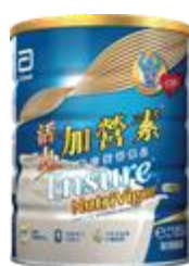
活力加營素 $217 / 850 克