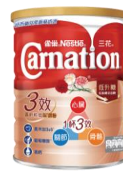
三花三效高鈣 較低脂奶粉 $110 / 800 克