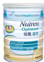
佳膳益生 $74 / 400 克 $145 / 800 克